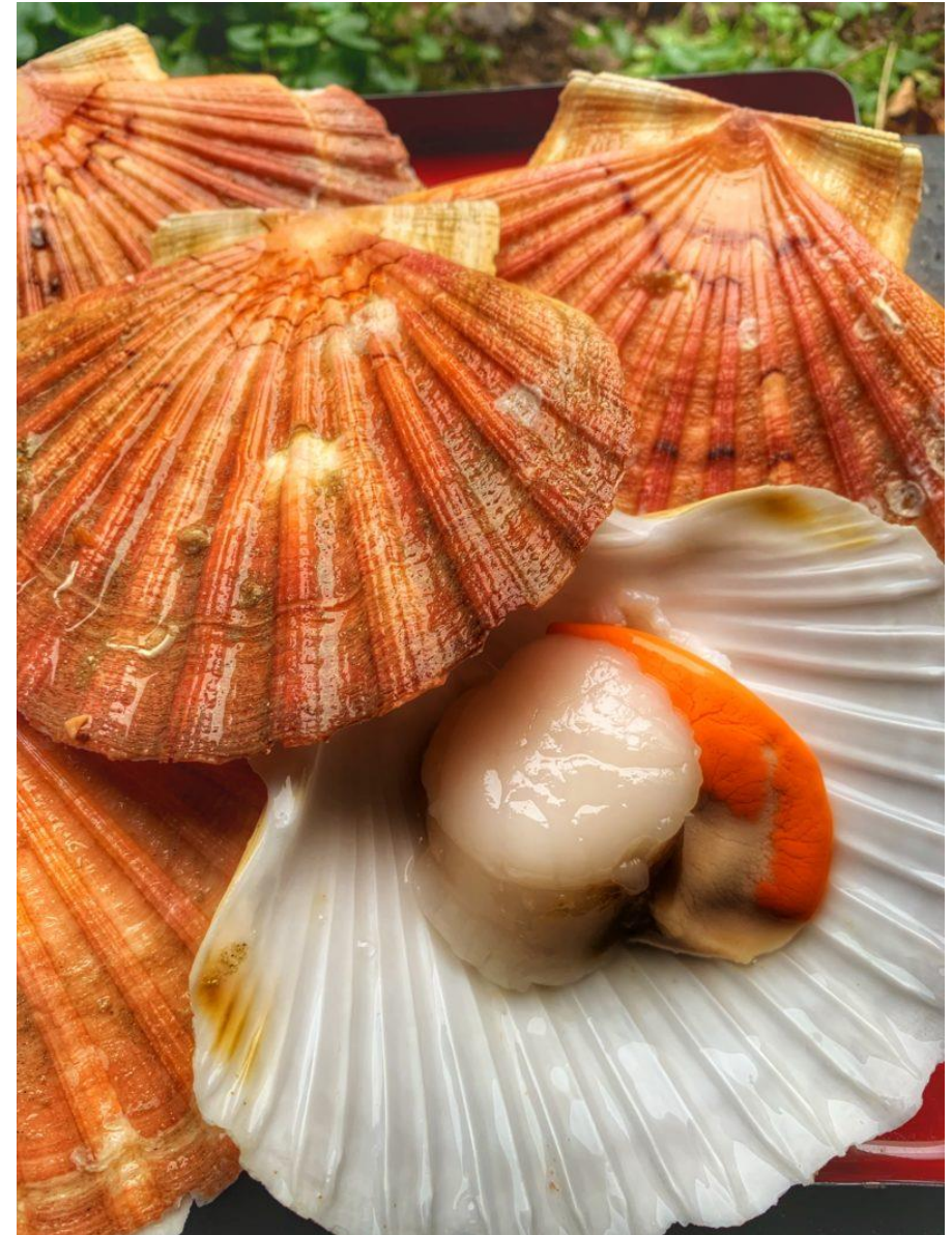
Pêche à la coquille Saint-Jacques